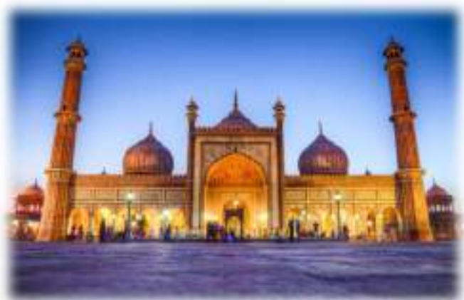
Moschea del Venerdì

DELHI è la capitale dell'India e la terza città in ordine di grandezza. Questa città si compone in due parti: Vecchia Delhi e Nuova Delhi. Vecchia Delhi era in passato interamente cinta da mura e conserva ancora oggi gran parte dello splendore di un tempo. Il cuore della città è Chandni Chowk una strada che si presenta come un unico grande e variopinto bazar, affollatissima sia di giorno che di notte. Nuova Delhi invece costruita in base ad un progetto urbanistico è caratterizzata da ampi viali alberati parchi e fontane. Il cuore di Nuova Delhi è Connaught Place su questa piazza si trovano la maggior parte degli uffici di banche agenzie e alberghi.