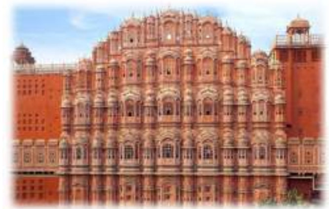
PPPalazzo dei Venti Jaipur

JAIPUR conosciuta anche come la città rosa, è famosa per il suo aspetto regale e le belle sculture. La città fu fondata dal Maharaja Sawai Jai Singh II. Egli fu un sovrano molto attivo che contribuì ampiamente allo sviluppo della città, studiando vari libri di architettura e anche consultando molti architetti in modo da dotarla del miglior aspetto possibile.